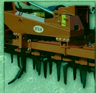
ROMPITRACCIA SUBSOILER SOUS-SOLEUSE SPUR BRECHER