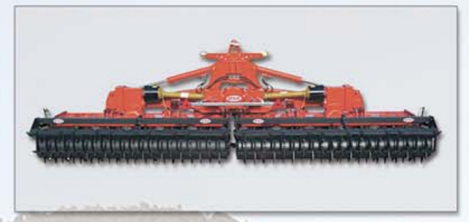
VISTA POSTERIORE BACK SIGHT VUE ARRIÈRE HINTERANSICHT