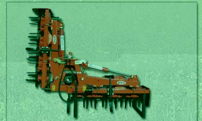
CHIUSURA IDRAULICA HYDRAULIC CLOSURE FERMETURE HYDRAULIQUE HYDRAULISCHE SCHLIEBUNG

HERSE ROTATIVE REPLIABLE MULTIVITESSES SÉRIES GEMINI POUR TRACTEURS ENTRE 80 ET 280 CV (59 - 206 KW) Cette herse rotative est utilisée pour travailler le sol afin de préparer et améliorer les terrains pour l'ensemencement dans le domaine de l'Agriculture.